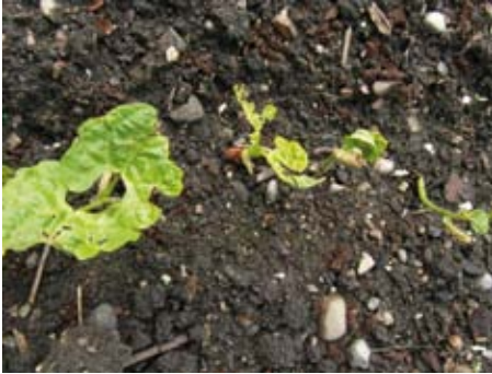
Wärmebedürftige Buschbohnen beim Auflaufen: Langsam und empfindlich auf Störungen

aber erst nach Mitte Mai (Bodentemperatur!). Man könnte ein paar Tage vor dem Säen den Boden zwar mit Belladonna C200 etwas „aufheizen“, damit die Samen ein bisschen früher gesteckt werden könnten, aber dann müssten die Keimlinge mit einem Flies vor Temperaturschwankungen geschützt werden. Das Flies andererseits erzeugt wiederum ein für Schnecken und Pilzkrankheiten günstiges Mikroklima... Haben die Bohnenkeimlinge ihre Köpfe erstmal aus dem