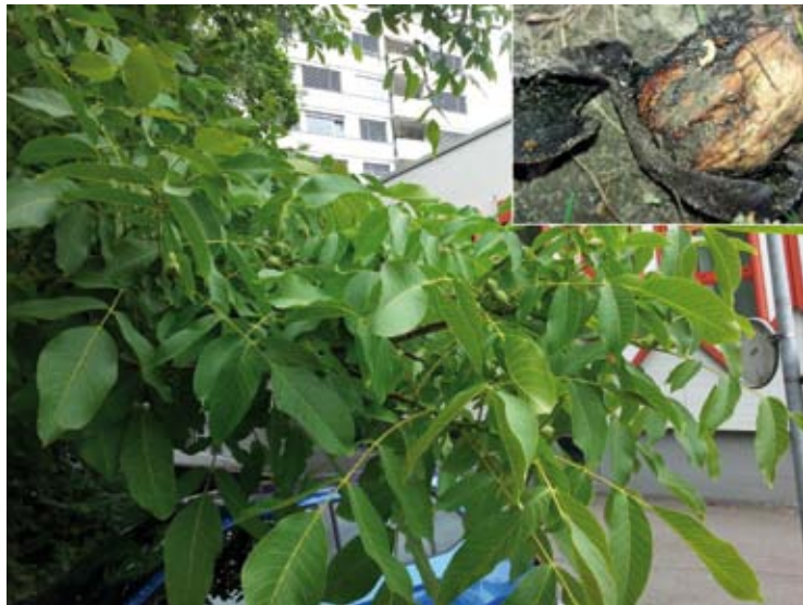
Walnussbaumast mit gesundem unversehrtem Fruchtansatz; Kleines Bild: Von der Walnussfruchtfliege zerfressene Nusschale

In den letzten drei Jahren erhielt unser Nussbaum jeweils im Frühling Silicea C200 zur Stärkung. Im 2013 waren trotzdem über die Hälfte der Nüsse von der Walnussfruchtfliege befallen. Im 2014 hängten wir die teuren gelben (aber immerhin wieder verwendbaren) Klebfallen an die Äste des Baumes. Darauf waren nur noch rund 30 % der Nüsse befallen. Den Anstoss für