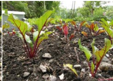
Links: Stagnierende Randensetzlinge mit dunkelroten Blättern bei nass-kalter Witterung im Mai Rechts: Randen eine Woche nach Belladonna Gabe bei immer noch nass-kalter Witterung