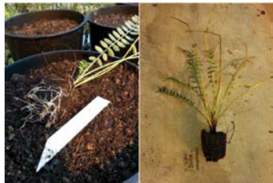
Vier Wochen alte Esparsetten-Stecklinge; fotografiert drei Wochen nach der Calendula -Behandlung; links mit und rechts ohne Calendula C30